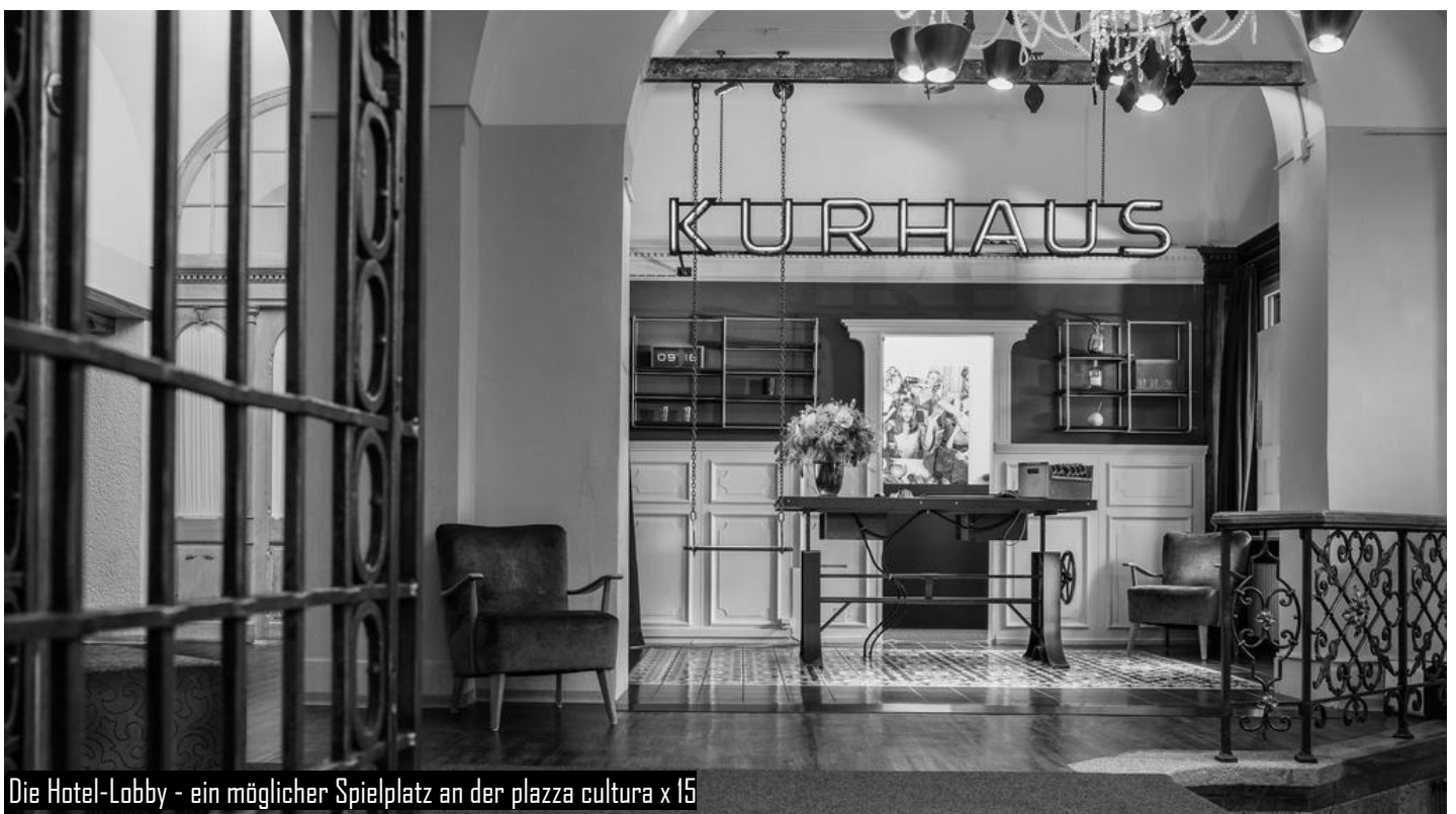
Die Hotel-Lobby - ein möglicher Spielplatz an der piazza cultura x 15