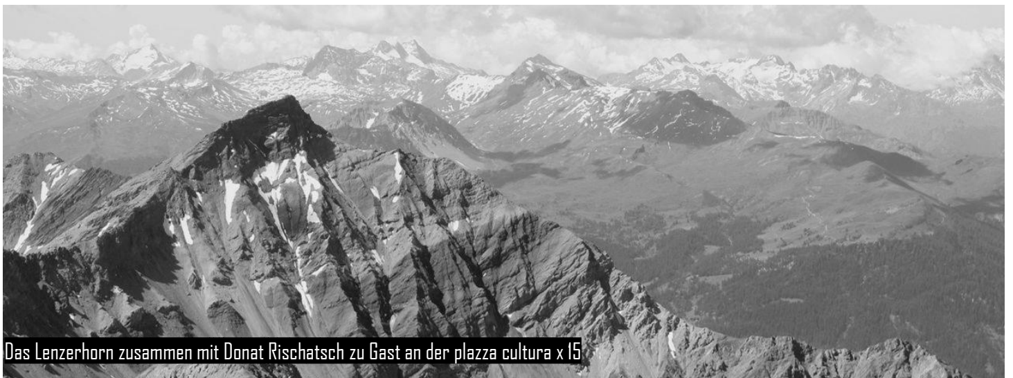
Das Lenzerhorn zusammen mit Donat Rischatsch zu Gast an der plaza cultura x 15

Eine unverpässliche Darfführung voll von Kurortgeschichte und Schweizerpsalm mit dem Lokalthistoriker Donat Rischatsch . Extra entworfen und beim Prosecco ausgedacht für die plaza cultura. Mit Sicherheit eine unvergessliche Darfführung mit ganz viel Neuem über d'Heid! Infos zur Führung auf www.hotel-lenzerhorn.ch