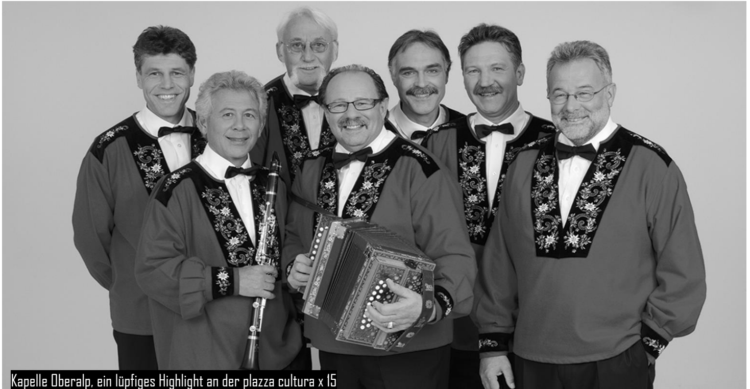
Kapelle Oberalp, ein lüpfiges Highlight an der piazza cultura x 15

Ein lüpfiges Stelldichein mit der bekannten Kapelle Oberalp , verbunden mit einem sommerlichen Racletteplausch mit Blick auf den See. Wenn Biker auf Bauern treffen, dann wird „bödelat“. Und wenn erst noch eine so grossartige Ländlerformation, bekannt aus TV und Radio, an der Talstation der Rothornbergbahnen zum Tanz aufspielt, dann muss man einen Halt machen. Reicht die Musik alleine nicht, dann mit Sicherheit der feine Duft von frischem Raclette! „ s hät Platz solangs Platz hät! “ Und das alles mit: www.kapelle-oberalp.ch