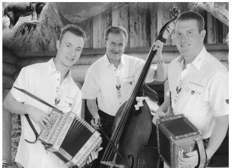
Bündner Spitzbueba auf dem Scalottas an der piazza cultura x 15

Ebenfalls auf dem Scalottas errichtet die Heidner Jungmannschaft mit ihren Fackeln das Kreuz am Hang unterhalb der June Hütte!